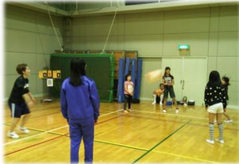
空きコートでは、子供たちも楽しんでいました。

優勝した亀渕自治会の方々は日頃から熱心に練習されており、今回3連覇を達成されました。素晴らしいですね。来年は、この強豪チームに勝るチームがあるのでしょうか。大変楽しみです。参加者のみなさん、大変お疲れ様でした。来年も盛り上げましょう。