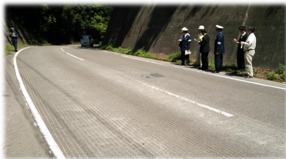
加茂署による事故現場状況説明

事故にあった方たちは、両者とも伊深の方ではなかったことが不幸中の幸いでしたが、身近な場所や通り慣れた道でも思いもよらぬ事故が起きることもありますので、みなさんも交通安全には十分ご注意ください。